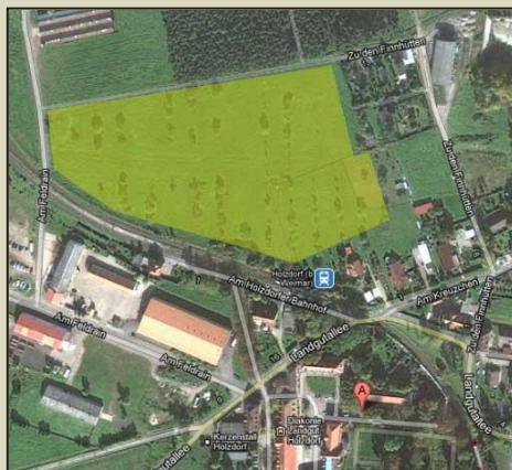
Streuobstwiese in Weimar – Holzdorf

Die Einzugsermächtigung kann jederzeit widerrufen werden.